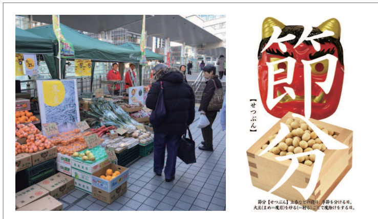
▲東京都品川区大崎でのマルシェや飲食店連携事業

弊社主宰で「日本まぜごはんの会」を発足し、全国の旬をまぜごはんにして発信する活動を行っております。東京都品川区大崎エリアで「おおさき二十四節気祭」を企画運営しております。駅前でのマルシェ販売などを行っております。商品卸業務も行っております。弊社の様々な出口（販売先）で「生産加工者様が商売」ができるよう用意しております。