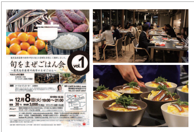
▲日本まぜごはんの会の活動