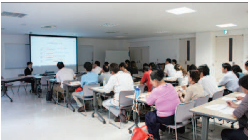
▲左：生産者様と「小売店では何が起きているか」の勉強会の様子。

生産加工者との商品磨き上げ。産直市場や道の駅など地方の出口強化、売上向上カリキュラム作成と指導など、様々な角度から支援しています。デザイン技術や、小売店での販売知識を、現場にお伝えしております。