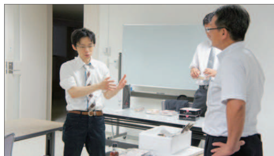
右：個別に「自社のこだわりをどう表現するか」を検討