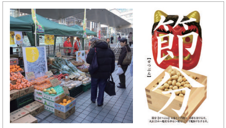
▲東京都品川区大崎でのマルシェや飲食店連携事業

弊社主宰で「日本まぜごはんの会」を発足し、全国の旬をまぜごはんにして発信する活動を行っております。東京都品川区大崎エリアで「おおさき二十四節気祭」を企画運営しております。駅前でのマルシェ販売などを行っております。商品卸業務も行っております。弊社の様々な出口（販売先）で「生産加工者様が商売」ができるよう用意しております。