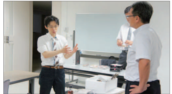
右：個別に「自社のこだわりをどう表現するか」を検討