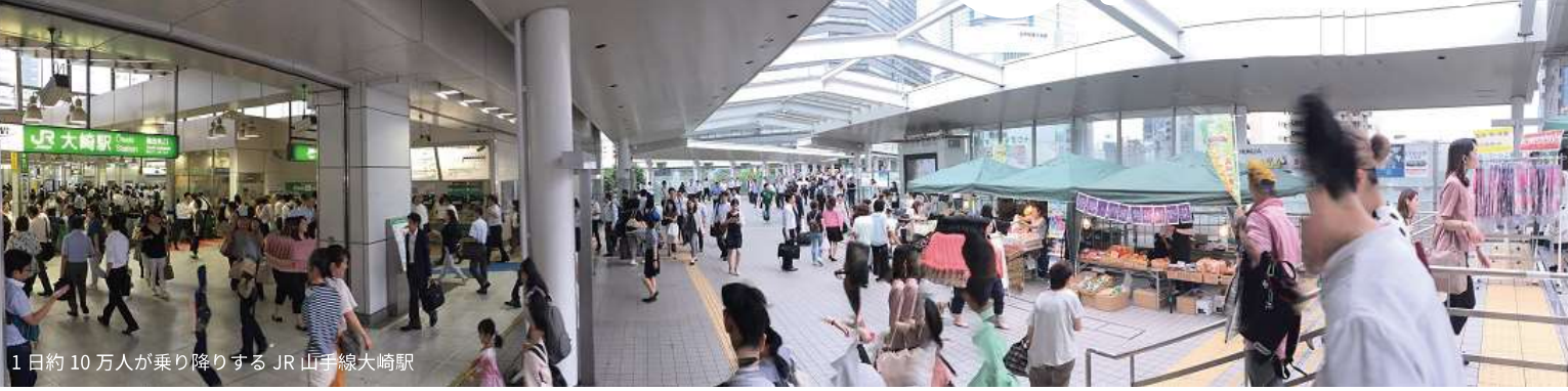
1日約10万人が乗り降りするJR山手線大崎駅