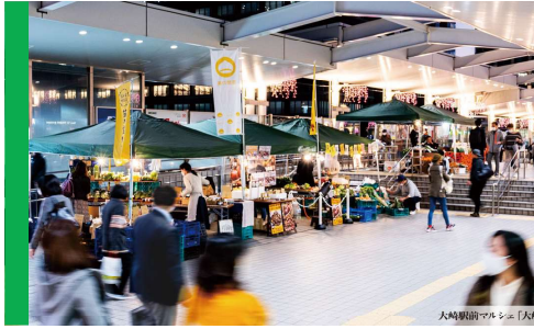
大崎駅前マルシェ「大